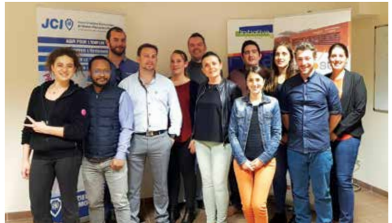
► Les membres de la dynamique JCE Béziers.