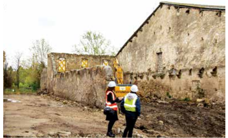
► Démolition avant toute chose.

Comment ? En procédant à la démolition totale ou partielle des habitations que l'Agglo a préemptées (les habitants ont été relogés avec l'aide de l'OPH et les rares artisans encore présents, accompagnés par l'Agglo dans leur réinstallation sur d'autres sites) afin