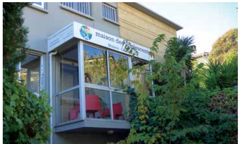
► Des locaux flambant neufs de 350 m 2 .

Nos enfants ne se font pas de cadeau, entre moqueries et agressions en tout genre. Pour l'Agglo, pas question d'abandonner ces jeunes en affliction. L'adolescence peut être une période compliquée à gérer. C'est parce que ce lieu existe que les ados peuvent trouver une oreille attentive, un soutien et des réponses afin de préparer au mieux