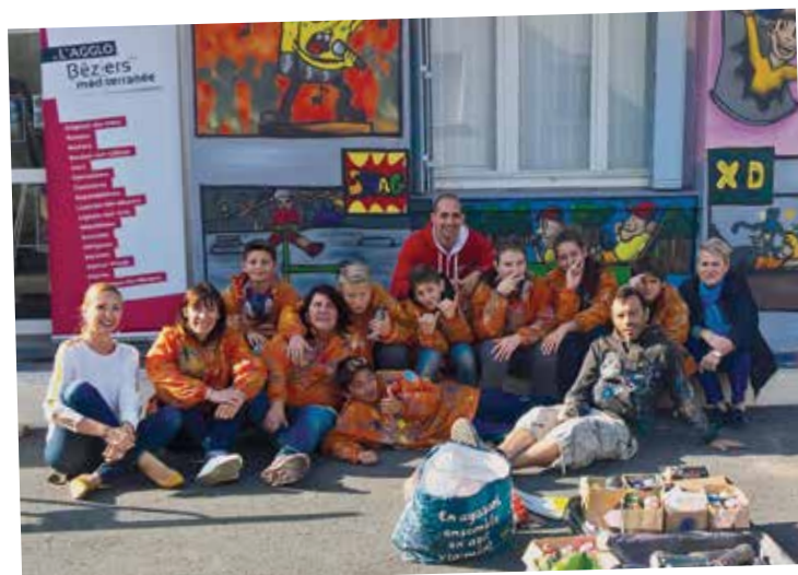
► La fresque murale de l'Entr'Ados à Valras-Plage.