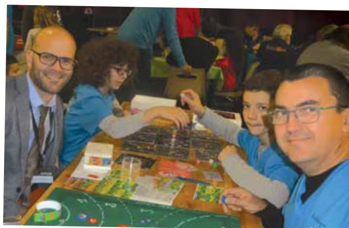
► Un festival autour du jeu à Lignan-sur-Orb.