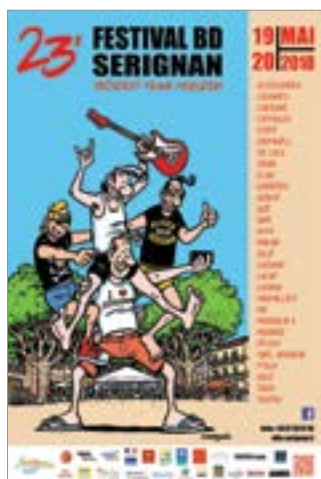
L'affiche du festival, réalisée par Franck Margerin

le domaine protégé des Orpellières, orné des peintures murales de Dado... Inutile d'écrire qu'entre vigne et plage, entre identité et modernité, il s'agit d'une commune des plus agréables dans le Biterrois. Il n'y a qu'à voir comment Sérignan a grandi en termes démographiques pour s'en convaincre, passant en 35 ans, de 3 884 habitants pour flirter aujourd'hui avec les 7 000. Elle est devenue une station classée de tourisme, accueillant 35 000 habitants l'été. Et, avec le lycée Marc-Bloch ou le port de plaisance, la croissance ne semble pas terminée... Il semble que le meilleur reste à venir... ■