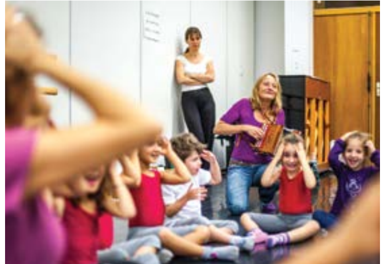
► Musique, danse et théâtre interagissent.

artistique mêlant ces trois disciplines. Dès 5 ans, les enfants sont immergés dans un bain de musique, danse et théâtre par groupes de 10 élèves. Accompagnés par trois professeurs, un par discipline, ils découvrent la richesse des échanges entre ces arts. Et au bout de trois ans, choisissent celui qu'il préfère. Lancé l'an dernier, ce « parcours des arts » suscite l'enthousiasme. Cette année, le Conservatoire innove encore avec son « atelier dansé parents-enfants ». Parents ou grands-parents et enfants partagent une heure de danse par semaine. Et renforcent leur relation grâce à des activités ludiques autour de l'écoute, du